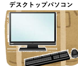
液晶モニター・周辺機器