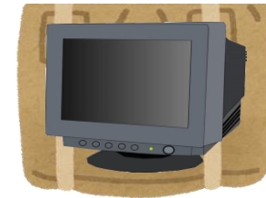
ブラウン管モニター