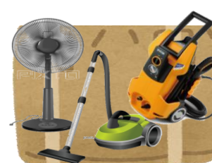
モーター関係機器 扇風機・掃除機・高圧洗浄機