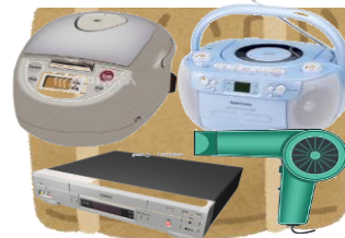
小物家電 横60cm×縦35cm 以内の家電