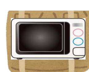
電子レンジ・オーブレンジ 横60cm×縦35cm 以上の家電