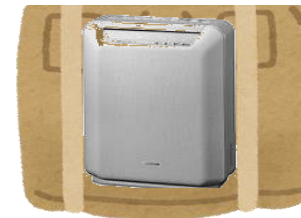
除湿器、冷風機、空気清浄機